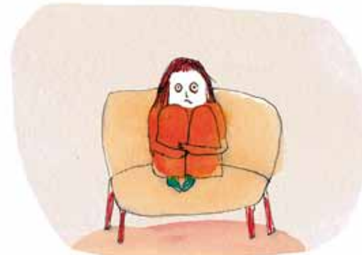
Mor er hele tiden bange. Ved du, hvad hun er bange for?