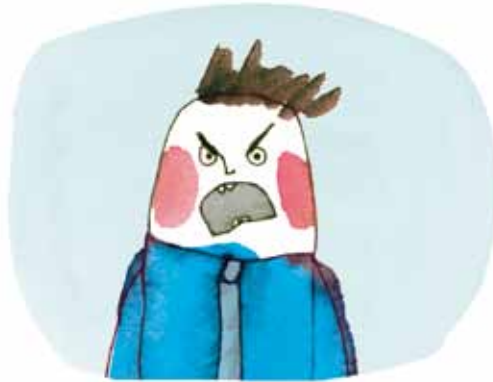
Far bliver let vred og råber højt.