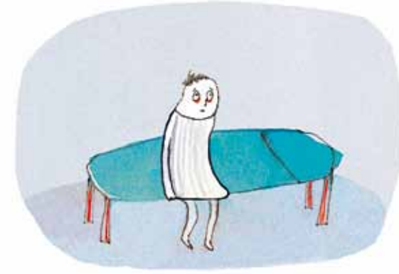
Selvom far er træt, kan han ikke sove. Eller også sover han hele tiden.