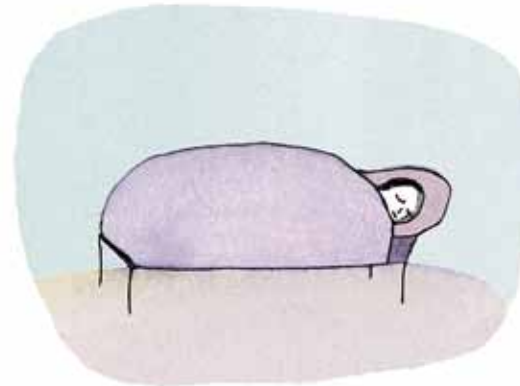
Mor er altid så træt.