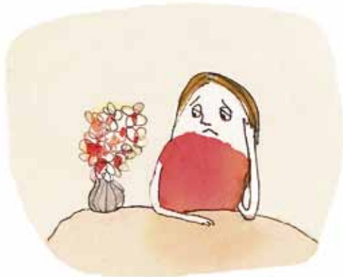
Mor er altid så trist.

Her er nogle mødre og fædre, der har en depression. Måske kan du genkende nogle af tegnene på sygdommen?