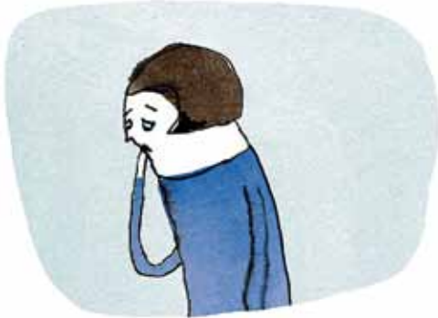
Mor synes ikke, at hun dur til noget som helst. Heller ikke til at være mor.