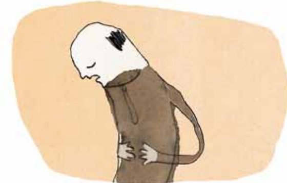
Far har tit ondt. Fx i maven, hovedet eller ryggen.