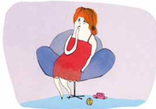
Mor har svært ved at huske.