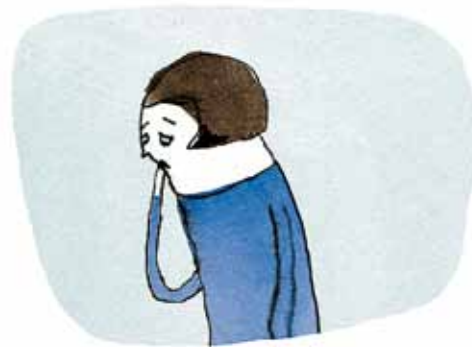
Nedsat selvtillid, selvbebrejdelser og skyldfølelse