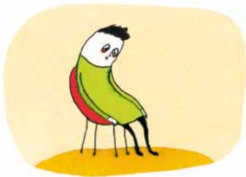
Træthed og nedsat energi