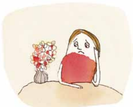
Glædesløshed og manglende interesse i hverdagen