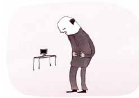
Fysiske smerter, fx ryg- og lændesmerter